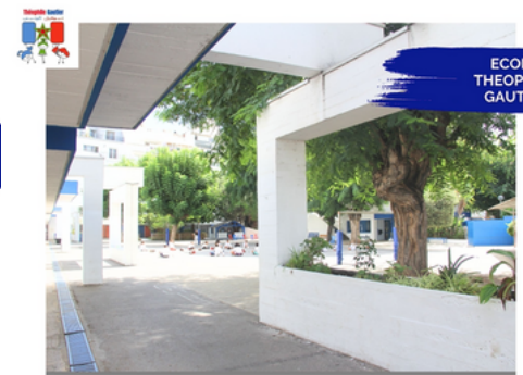
ECOLE THEOPHILE GAUTIER