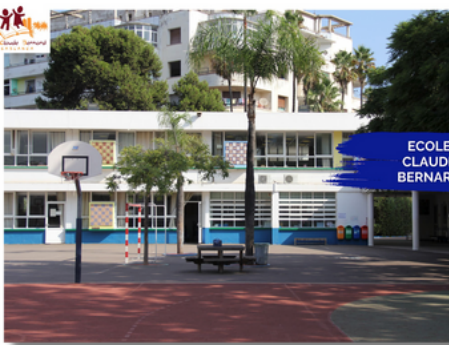
ECOLE CLAUDE BERNARD

Travailler en réseau permet également aux enseignants de mutualiser leurs pratiques, partager leurs expériences et enrichir les projets pédagogiques, pour offrir une expérience enrichissante et harmonieuse à tous les enfants.