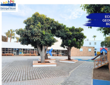
ECOLE GEORGES BIZET