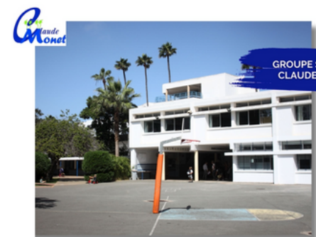
GROUPE SCOLAIRE CLAUDE MONET