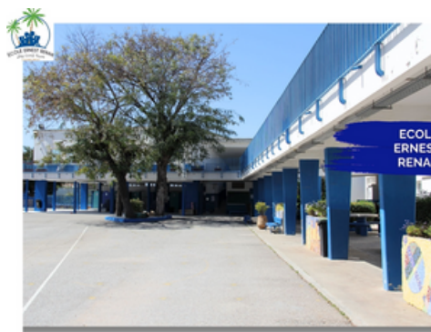
ECOLE ERNEST RENAN